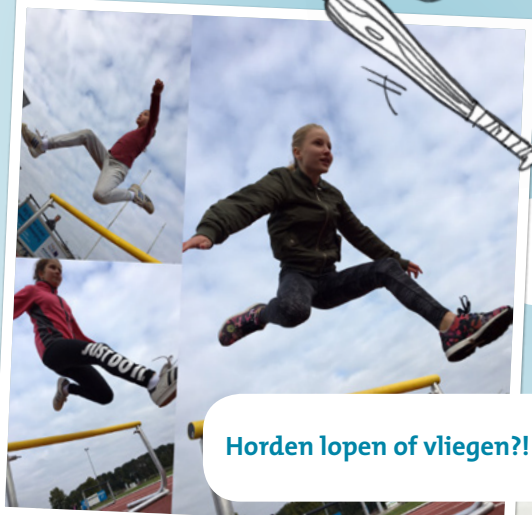
Horden lopen of vliegen?!