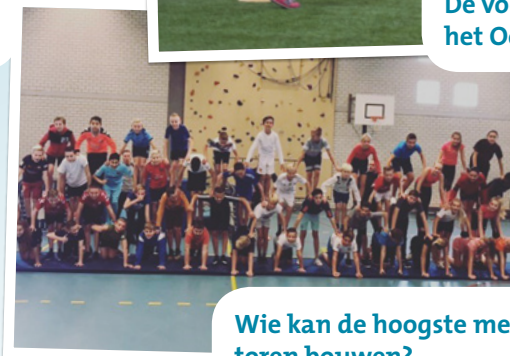
Wie kan de hoogste menselijke toren bouwen?