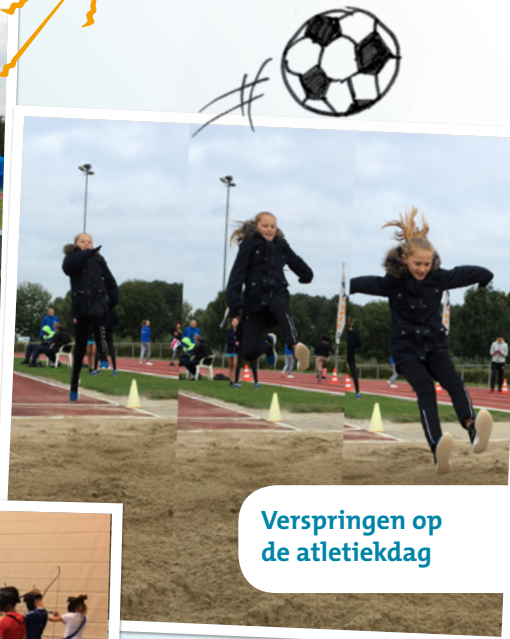
Verspringen op de atletiekdag