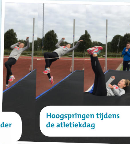
Hoogspringen tijdens de atletiekdag