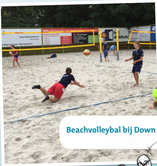
Beachvolleybal bij Down Under