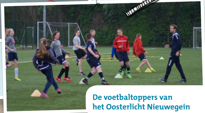
De voetbaltoppers van het Oosterlicht Nieuwegein