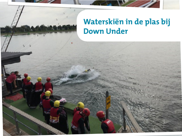
Waterskiën in de plas bij Down Under